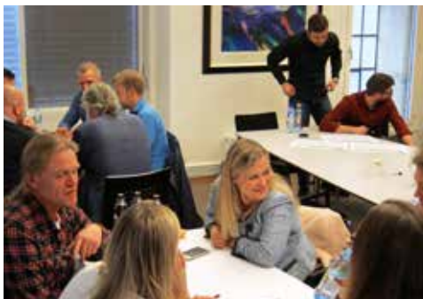
I løpet av 2017 vil alle medarbeidere i Ringnes introduseres for selskapets kompass.

Som ansvarlig markedsleder skal Ringnes alltid opptre på en god måte og i tråd med gjeldende retningslinjer. Gjennom introduksjonen av konsernets kompass ble alle holdnings- og adferdsstyrende rutiner samlet